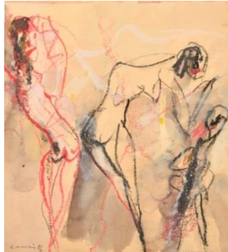
Editions-Reihe 01 – Variation B