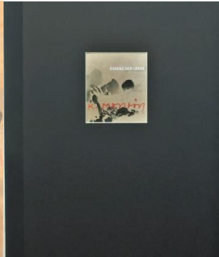
Editions-Grafik-Mappe mit CD