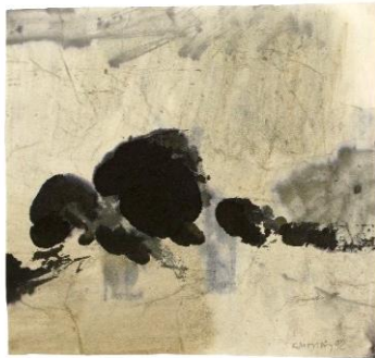
Editions-Reihe 01 – Variation A